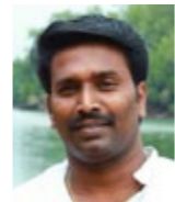
അഞ്ചിഷ് ഡോഡ്ജ് ഹൈനേക്കോ

ഞാൻ സ്നേഹിക്കുന്നവരിൽ ഒരാളൊഴികെ മറ്റുള്ളവരെല്ലാം എനിക്കിമുഖമായി പൂഞ്ചിരി തുകി ഇരിക്കുമ്പോൾ ഒരാൾ മാത്രം എന്തേ മുഖം തിരിഞ്ഞിരിക്കുന്നു. എന്നെ മനസിലാക്കുവാൻ ഇനിയും ദിനങ്ങൾ വേണമെന്നോ? ഒരു പക്ഷെ എന്റെ മരണം കൊണ്ടെങ്കിലും നിന്റെ മുഖം തിരിയുമെങ്കിൽ ഞാനൊരുക്കമാണ്... എന്തിനെന്നോ നിന്റെ സ്നേഹം അനുഭവിക്കാൻ അങ്ങനെയെങ്കിലും ഞാൻ പറയാതെ നിന്റെ കരങ്ങൾ എന്നെ പുണരുന്നല്ലോ!