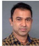
സജീവ് നമ്പൂർ കോയിലപ ജമൈക്ക