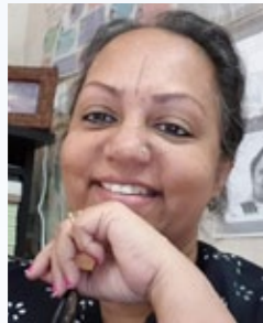
സപ്ത അനുബിജോർജ്ജ് ഒമാൻ