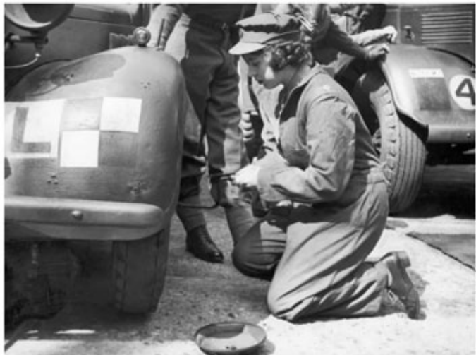
Princess Elizabeth learning car maintenance in 1945.