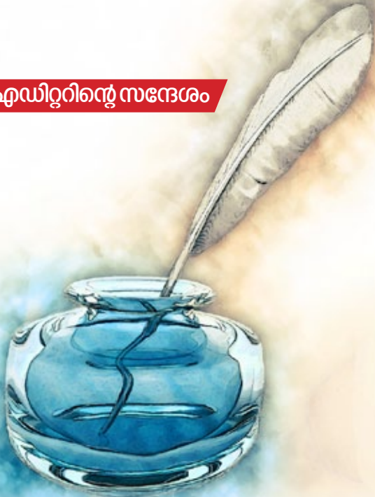
സപ്ത അനുബിജോർജ്ജ് ചീഫ് എഡിറ്റർ, ഒമാൻ