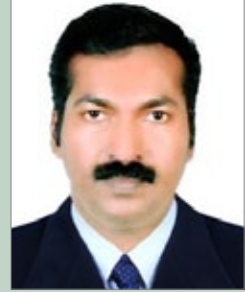
അൻസാർ, സൗദി അറേബ്യ