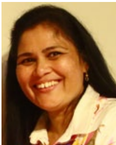
ജെസ്സി മേരി സോളി ജോൺ ഫ്ലോറൻസ്, ഇറ്റലി

കുക്കറിന്റെ ആവി പോയതിനുശേഷം, ഉരുള കിഴങ്ങ് മാറ്റിവെക്കുക. സൂപ്പ് അരിച്ചെടുത്ത്, അതിലേക്ക് വെന്ത ഉരുളകിഴങ്ങ് നന്നായി ഉടച്ചുചേർത്ത് മാറ്റിവയ്ക്കുക. ഒരു ചട്ടിയിൽ അല്പം എണ്ണ ഒഴിച്ചു, പൊടിയായി അരിഞ്ഞ സവാള ചേർത്ത്, ബ്രൗൺ കളർ ആകുന്നത് വരെ, വഴറ്റിയ ശേഷം, കറുവാപ്പട്ട പൊടിച്ചതും കുരുമുളകുപൊടിയും ചേർക്കുക. അതിലേക്ക് സൂപ്പ് ചേർത്ത് തിളപ്പിക്കുക. തീ അണച്ചശേഷം, അതിലേക്കു മുട്ടയുടെ വെള്ള പതപ്പിച്ചത് തുടരെ ഇളക്കി നൂൽ പരുവത്തിൽ ഒഴിച്ചു പതുക്കെ ഇളക്കിച്ചേർക്കുക. മല്ലിയില ചേർത്ത് ചൂടോടെ ഉപയോഗിക്കാവുന്നതാണ്.